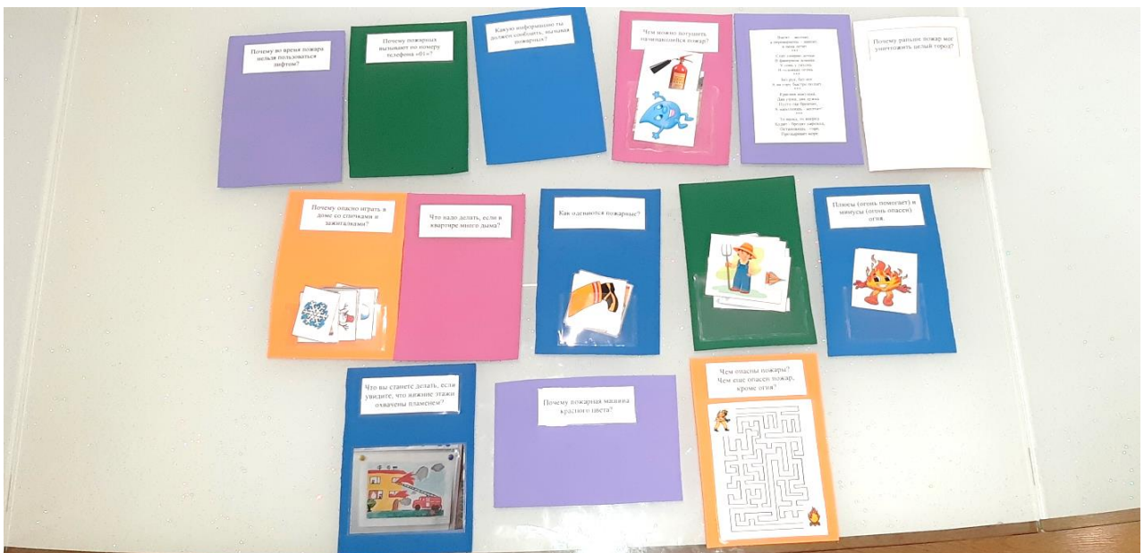
Оборотная сторона дидактических карточек с заданиями