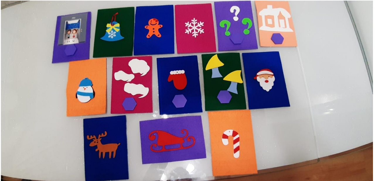
Лицевая сторона дидактических карточек с заданиями