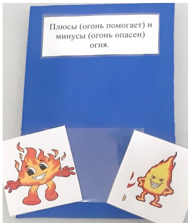
Дидактическая карточка с заданием «Огонь - друг, огонь - враг»