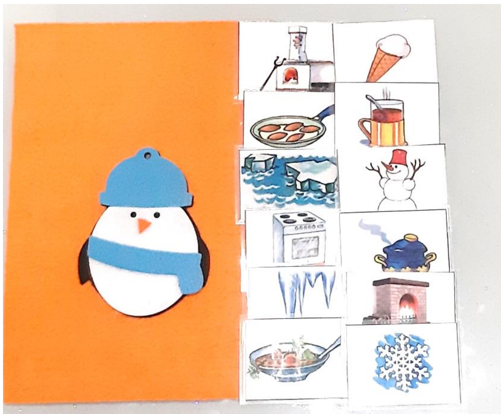
Дидактическая карточка с игрой «Холодно-горячо»