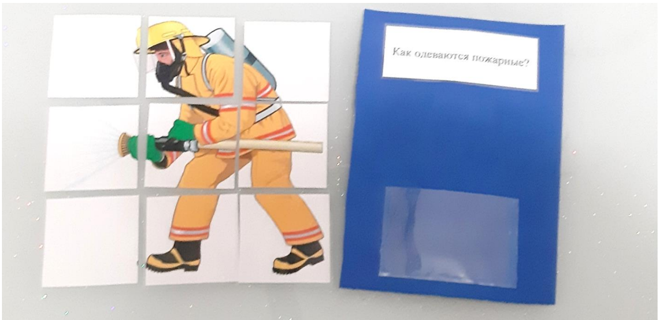
Дидактическая карточка с заданием (пазл)