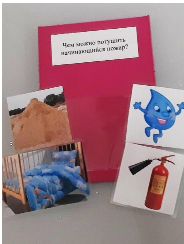
Дидактическая карточка с вопросом