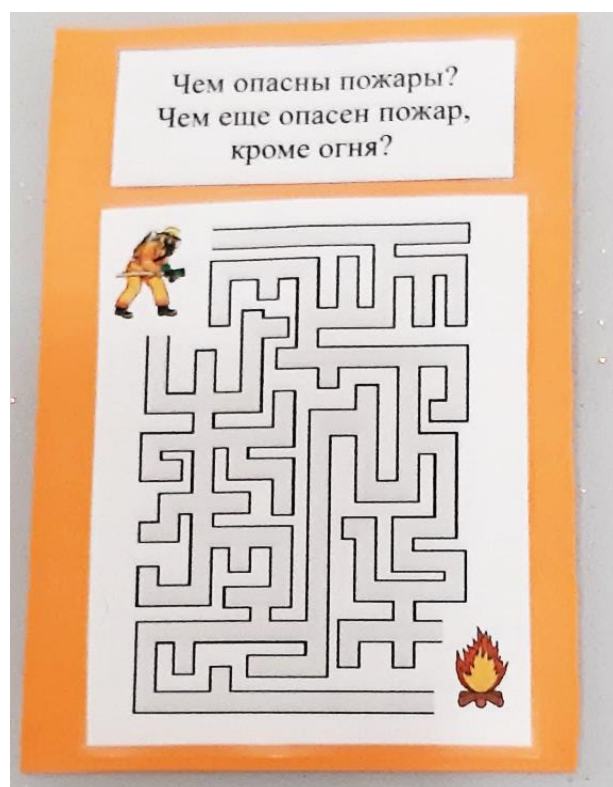
Дидактическая карточка с заданием «Лабиринт»