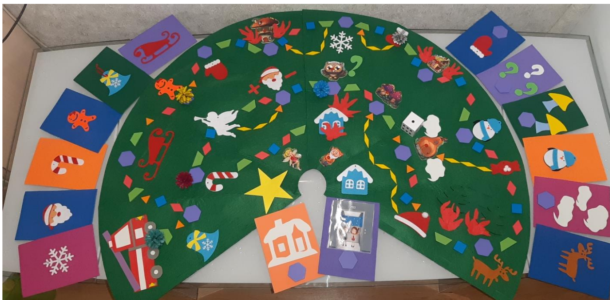
Дидактическая игра «Огнеборцы»: игровое поле и карточки