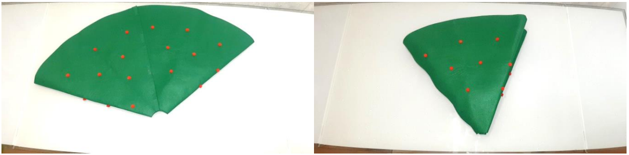
Игровое поле трансформируется