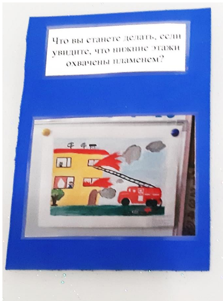
Дидактическая карточка – ситуация