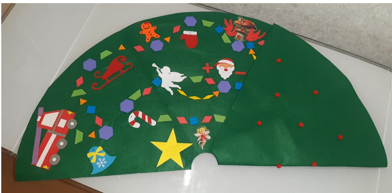
Дидактическая игра «Огнеборцы»: игровое поле