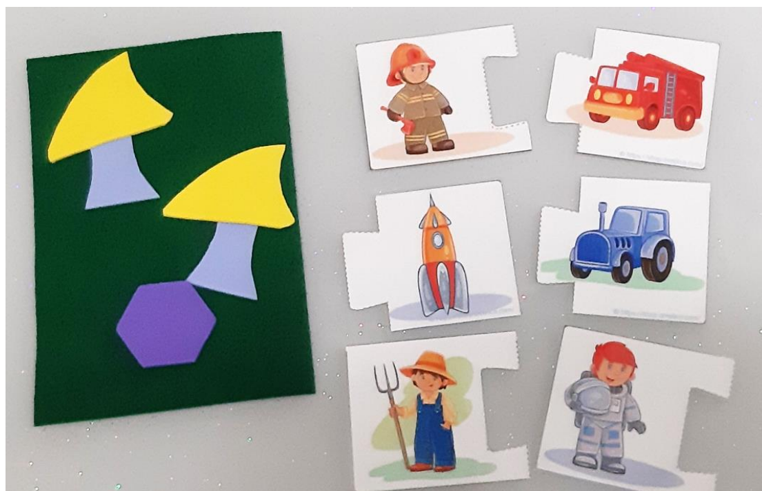
Дидактическая карточка «Парные картинки»